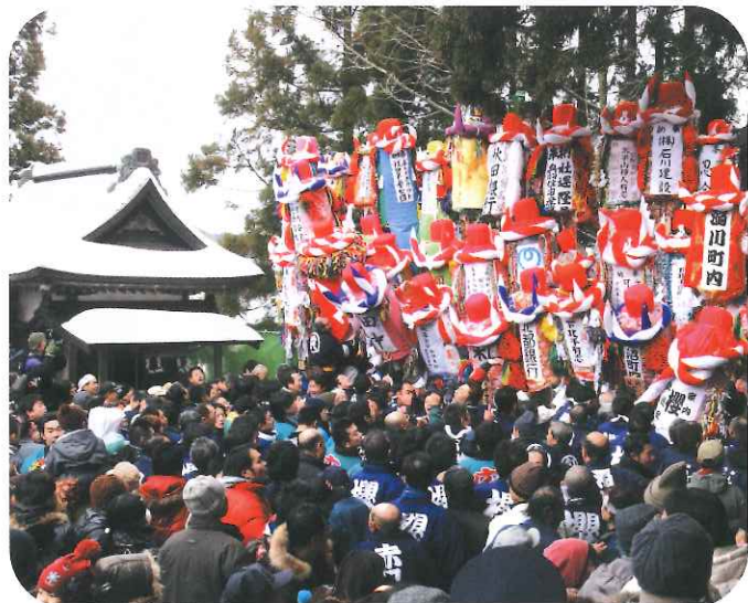
大平山に向かって奉奠（平成28年1月17日）