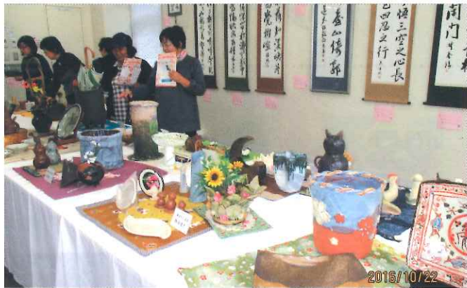
文化サークルの展示