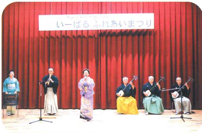
東謡会の演奏風景