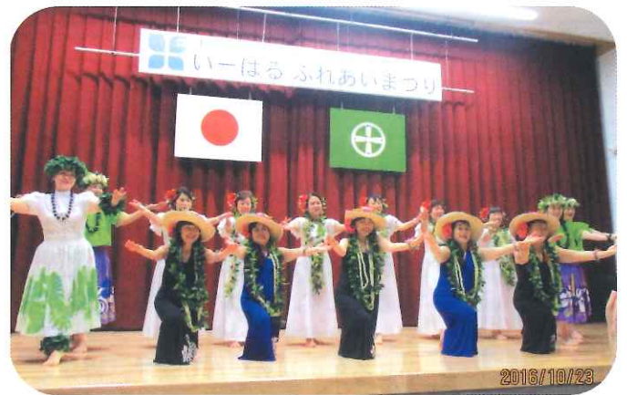
フラ・ハイビスカスの美人揃い