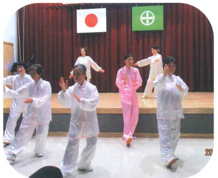
太極拳「立華」サークルの演舞