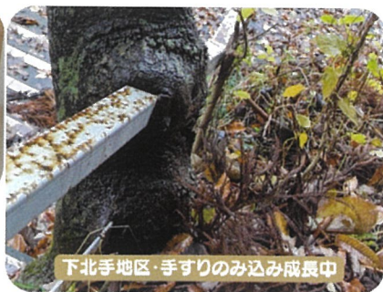
下北手地区・手ずりのみ込み成長中