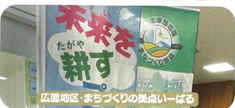
広面地区・まちづくりの拠点いーはる