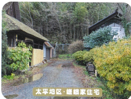
太平地区・嵯峨家住宅