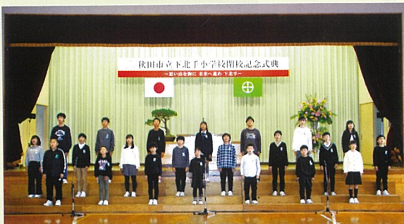
生徒による最後の校歌斉唱