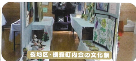
桜地区・横森町内会の文化祭