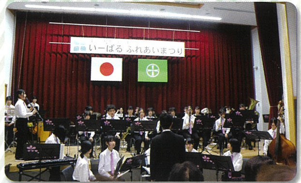
桜中学校吹奏楽部