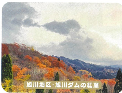
旭川地区・旭川ダムの紅葉