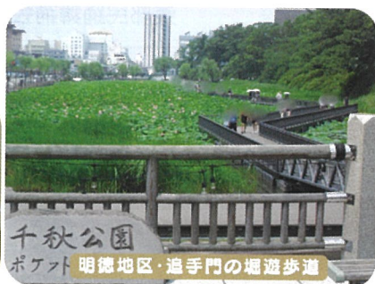
千秋公園 ポケット 明徳地区・追手門の堀遊歩道