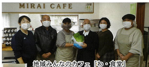
地域みんなのカフェ「わ・食堂」