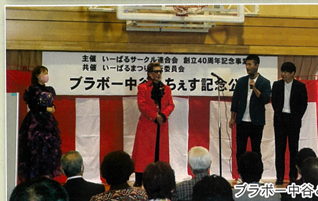
ブラボー中谷&ちえす記念公演会