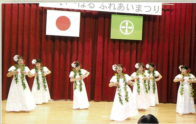
フラ・ハイビスカス