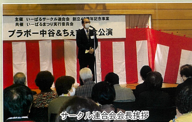
サークル連合会会長挨拶