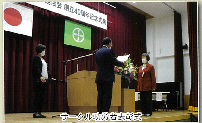
サークル功労者表彰式