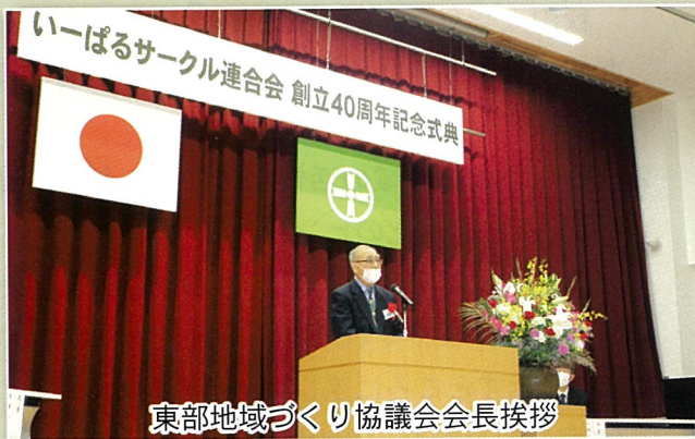
東部地域づくり協議会会長挨拶