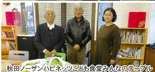
秋田ノーザンハピネッツこども食堂みんなのテーブル